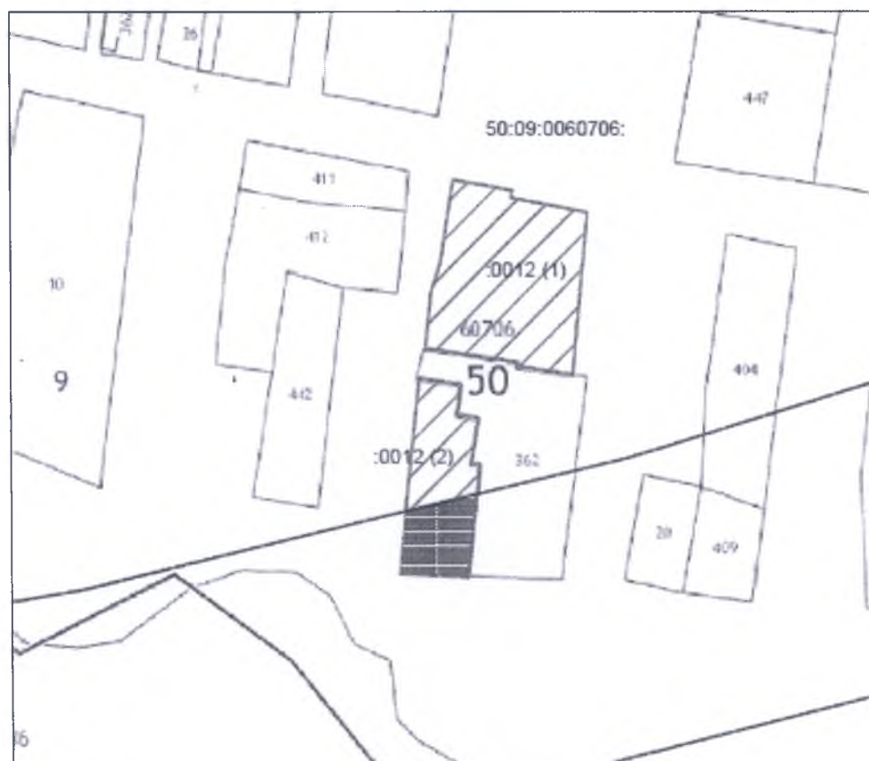
Схема размещения земельного участка площадью 292 кв.м, подлежащего изъятию для государственных нужд Российской Федерации путем выкупа, под строительство комплекса взлетно-посадочной полосы Международного аэропорта Шереметьево

Приложение к приказу Федерального агентства воздушного транспорта от 25.10.2013 № 403